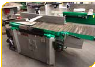
Dégau/robot LUREM RD41 Largeur de rabotage 410mm