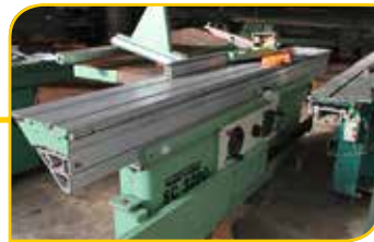
Scie à format SICAR SC3200