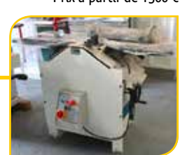
Dégau/robot Kimac RD310E