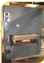
Ponceuse large bande SCM 950mm