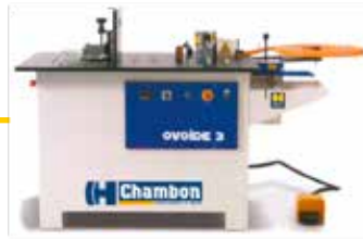
Plaqueuse de chants Chambon ovoïde