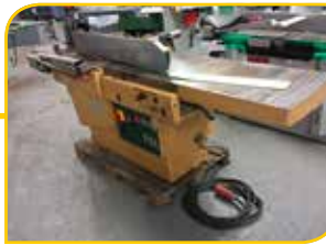
Dégauchoiseuse SCM F5L Largeur de travail 500mm