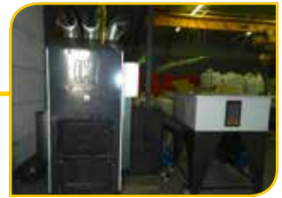
Générateur d'air chaud bois automatique aux briquettes