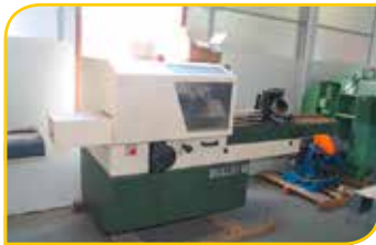
Corroyeuse Guilliet Machine de démonstration Prix à partir de 4950 €