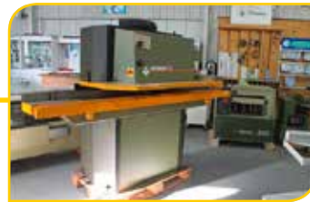
Profileuse Vertongen 2 arbres LG : 470mm