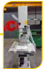
Scie à ruban Meber ø 400 et ø 500mm Machine neuve. Prix à partir de 1500 €